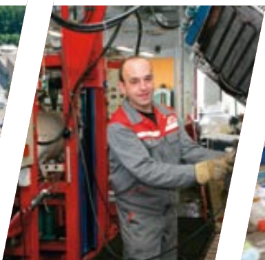
Triedenie obalového materiálu v Hörschingu (Horné Rakúsko)